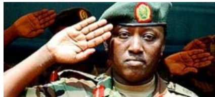
Karake va ser processat el 2008 per l'assassinat de Flors Sirera

GEMMA CAMPS | MANRESA El processat número 4 per l'assassinat de la cooperant manresana Flors Sirera a Rwanda l'any 1997, el general de brigada Karenzi Karake, va ser detingut ahir a Londres, segons va confirmar a aquest diari Jordi Palou-Loverdos, advocat de la causa de Flors Sirera.