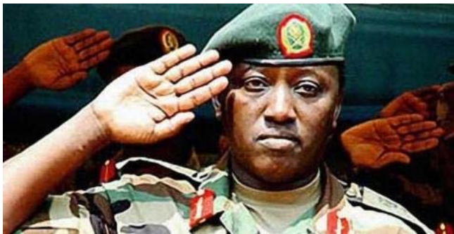
El militar ruandés Karenzi Karake, acusado por la Audiencia de genocidio.