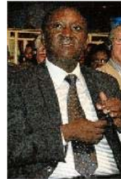
El general Karenzi Karake regió7

FRANCESC GALINDO | MANRESA Les famílies de Flors Sirera, la infermera manresana assassinada a Ruanda, i dels altres vuit cooperants i religiosos espanyols morts durant el genocidi de la regió africana dels Grans Llacs han fet públic un pronunciament conjunt en què demanen al govern britànic que lliuri a la justícia el general Karenzi Karake, detingut dilluns en compliment de l'ordre d'arrest internacional que pesava sobre ell.