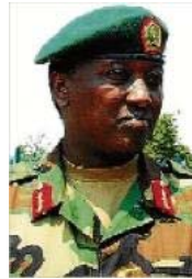
El general Karenzi Karake regió7

FRANCESC GALINDO | MANRESA El cap dels serveis secrets ruandesos, el general Karenzi Karake, durà una polsera electrònica per estar localitzable les 24 hores fins a la celebració de la vista d'extradició els dies 29 i 30 d'octubre que decidirà si és lliurat a les autoritats espanyoles per ser jutjat per l'assassinat de la infermera manresana Flors Sirera i de vuit cooperants i religiosos més en el marc del genocidi de la regió africana dels Grans Llacs.